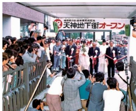
▲創業時のテープカットの様子