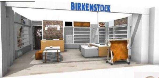
▲画像は店舗イメージです。